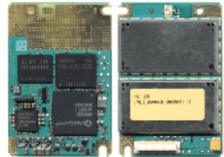
Siemens HC15 Siemens HC25