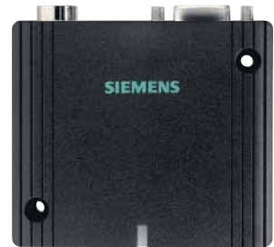
Siemens MC35i T Siemens TC35i T