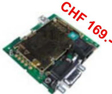
TC65i TM-Platine (ohne Gehäuse)