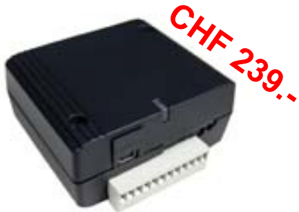
TC65i GPIO Terminal (mit Gehäuse) GPIO's rausgeführt