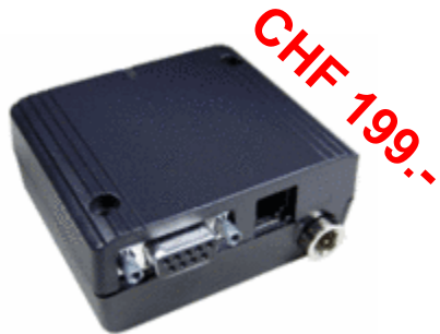
TC65i Terminal (mit Gehäuse) 1x Serielle Schnittstelle

Mit jedem Modul wird bei der ersten Lieferung ein SDK-Software Development Kit ausgeliefert.