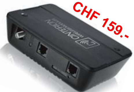
TC65 Terminal Alte Version 1x Serielle Schnittstelle + GPIO's