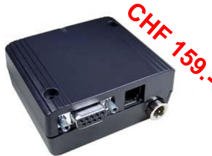
MC88 Terminal (mit Gehäuse) Letztes Generation Mit EG55-LGA-Model

Mit jedem Modul wird bei der ersten Lieferung ein SDK-Software Development Kit ausgeliefert.